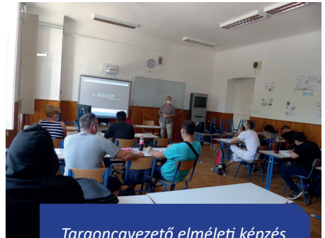
Targoncavezető elméleti képzés