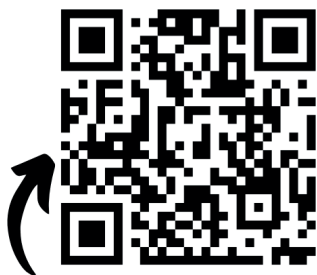
SZKENNELHETŐ QR KÓD

QR KÓDOS FOTÓMONTÁZS A PROJEKT MEGVALÓSÍTÁSÁRÓL