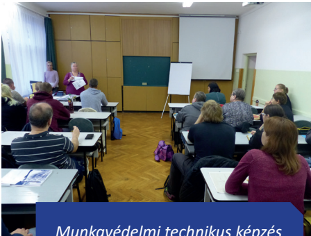
Munkavédelmi technikus képzés