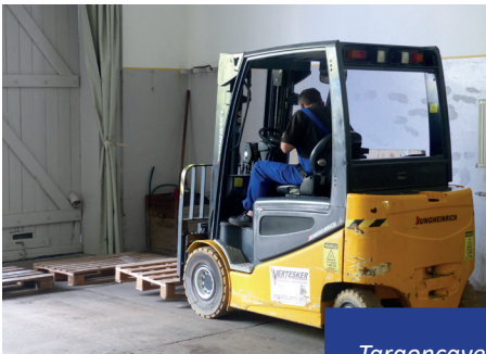
Targoncavezető gyakorlati képzés